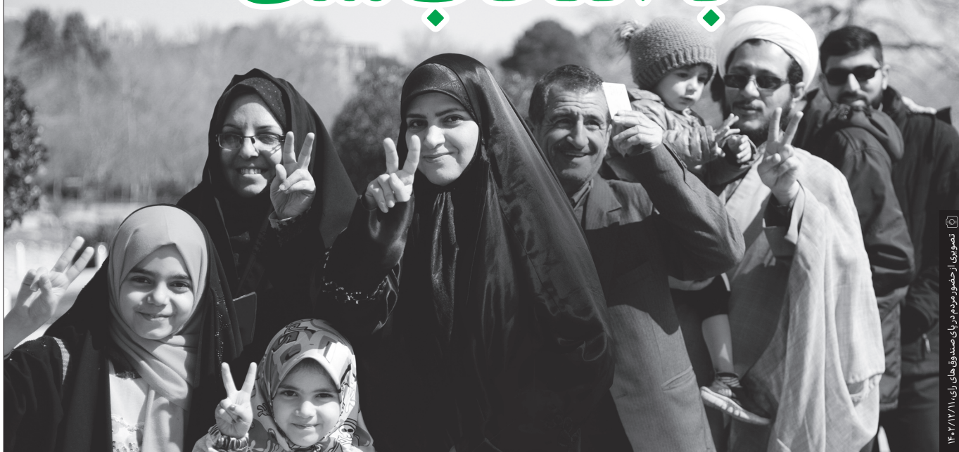
تصویری از حضور مردم برای صندوق‌های رای، ۱۴۰۲/۱۲/۱۱

همچنانکه معلوم است، از بالاترین مسئول کشور، از رهبری، ریاست جمهوری، مسئولین گوناگون دیگر، با انتخاب ملت مسئولیت پیدا میکنند و سرکار می‌آیند.»