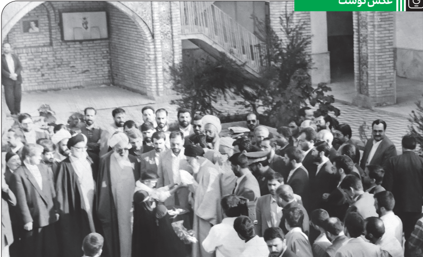
حضور و سخنرانی رهبر معظم انقلاب در گلزار شهدای هویزه، ۱۳۷۵/۱۲/۲۰