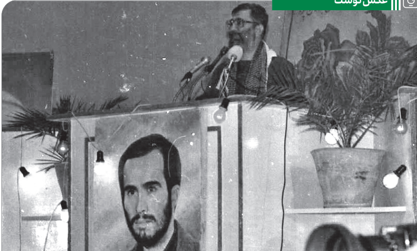
سخنرانی آیت الله خامنه ای در جمع رزمندگان لشکر ۱۴ امام حسین علیه السلام