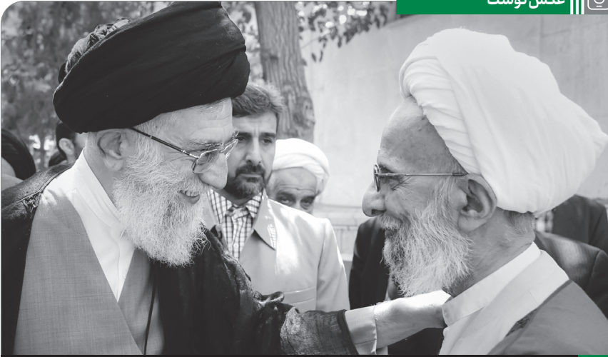
تصویری از دیدار صمیمانه آیت الله مصباح یزدی با رهبر انقلاب، سال ۱۳۹۳